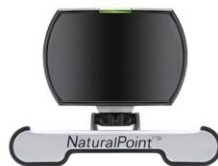
SmartNav™ Ratón por Webcam