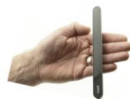
Tobii PCEYE Mini