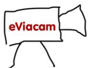
Ratón facial gratuito para Ordenador