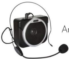
Amplificador de voz